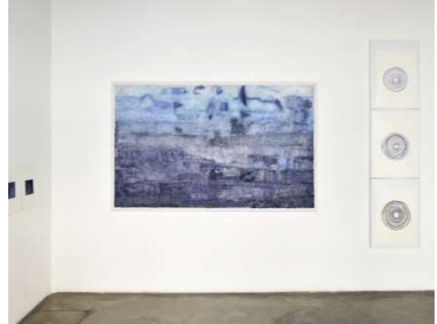
chacun son trait exposition Galerie Françoise Besson, 2019