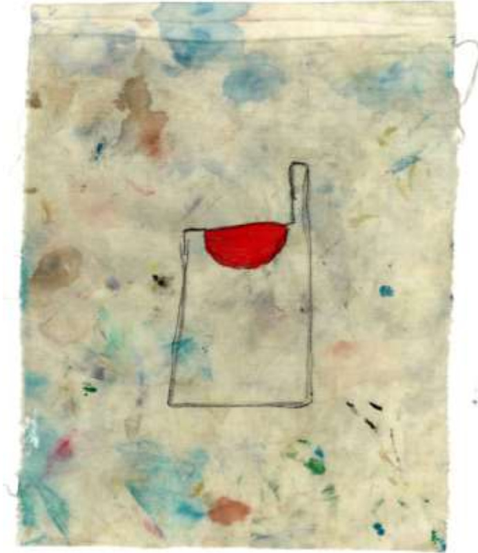
je dessine, vous brodez... B107 dessin sur chiffon 2010-2017