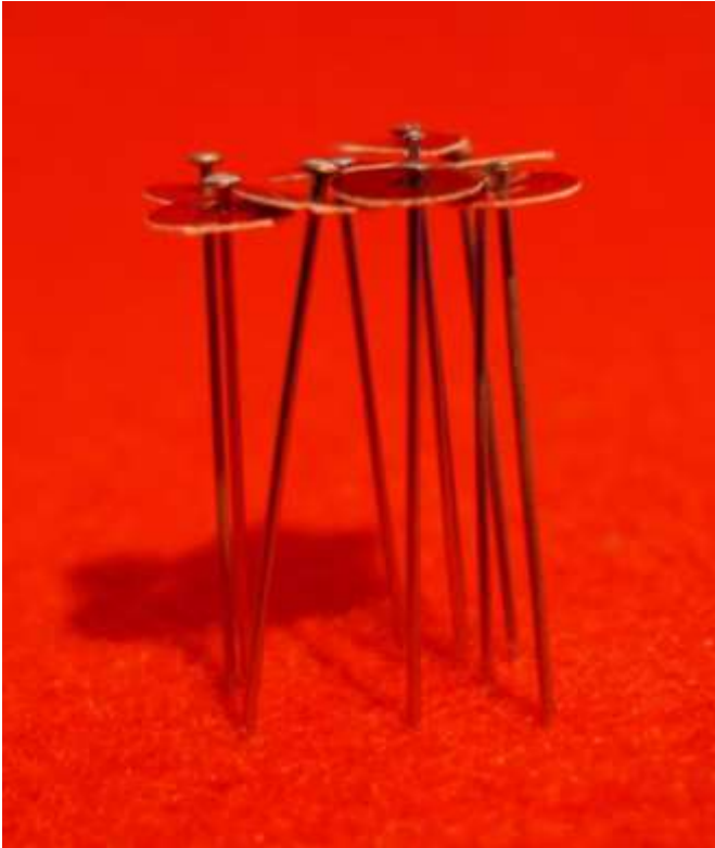
compost photo confetti photo piqué d'épingle 2005-2020