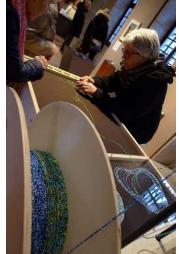
#3km614 œuvre participative, fil nylon, perles de rocailles table de production au Palais de l'île, Musée Château Annecy, 2011 – 2023 actuellement 1 998 m de réalisé !