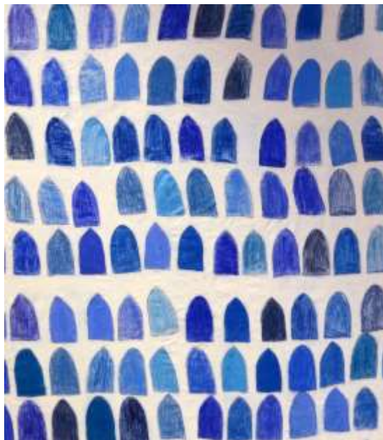
chacun son trait œuvre participative pastels à l'huile sur drap Parcours culturel Contamine s/Arve, 2015-2016