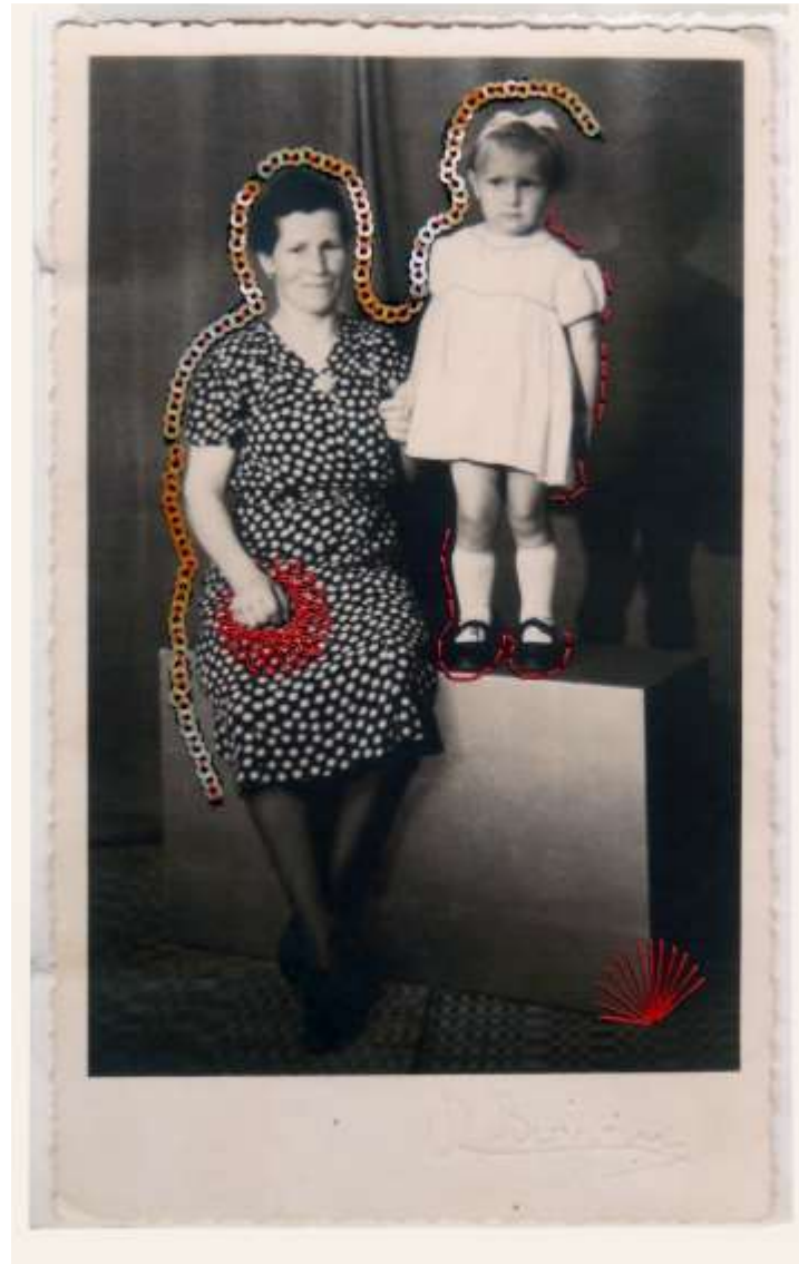
Elle s'appelait Aniela, Angèle, Agnès série AAA feuille de cuivre, sequins, fil de couture 13,5x21 cm, 2019