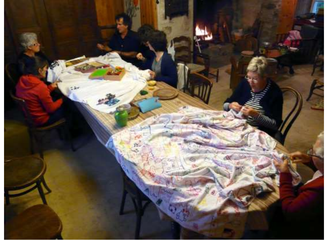
je dessine, vous brodez... exposition l'endroit , Centre d'art L'arteppes, Annecy 2011 et atelier - dimanche en famille, 2012