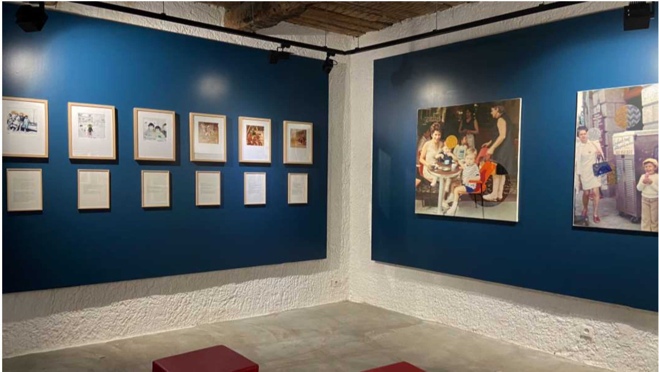
Vue de l'exposition, Musée des Arts et Traditions Populaires, Draguignan, 2023