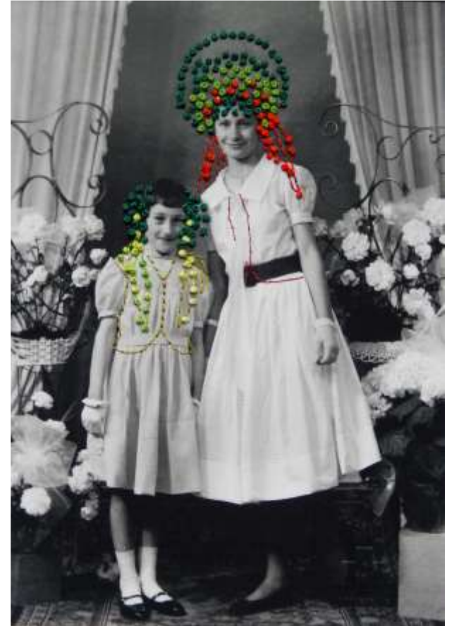
Enfant je me tenais toujours sur les genoux de mon père Rideau 19 x 24 cm Les scaphandres 13,5 x 20,5 cm Origines 17 x 23 cm photo, écheveaux de fil de broderie, crochet, broderies, 2023