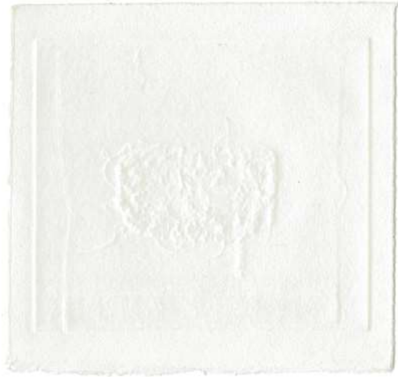
je dessine, vous brodez... (ra)contard devant un gaufrage résidence Saint-Gervais, 2015