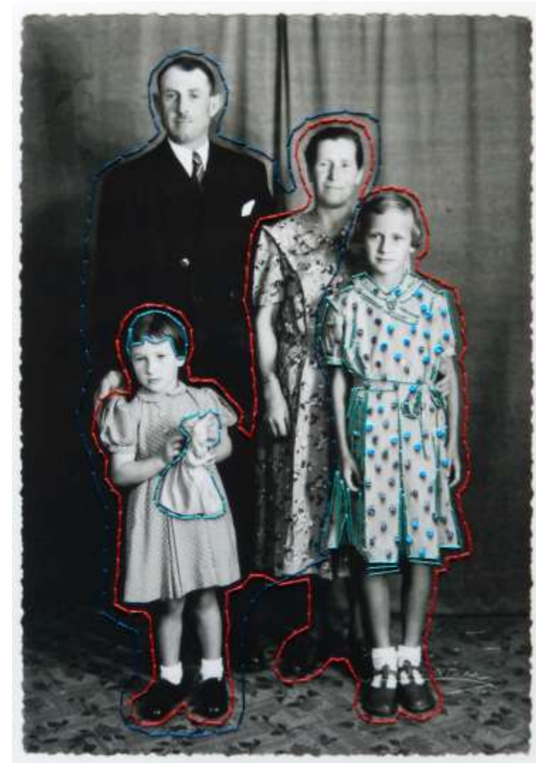
Recomposition photo, fil de couture et broderies 17 x 24 cm, 2023