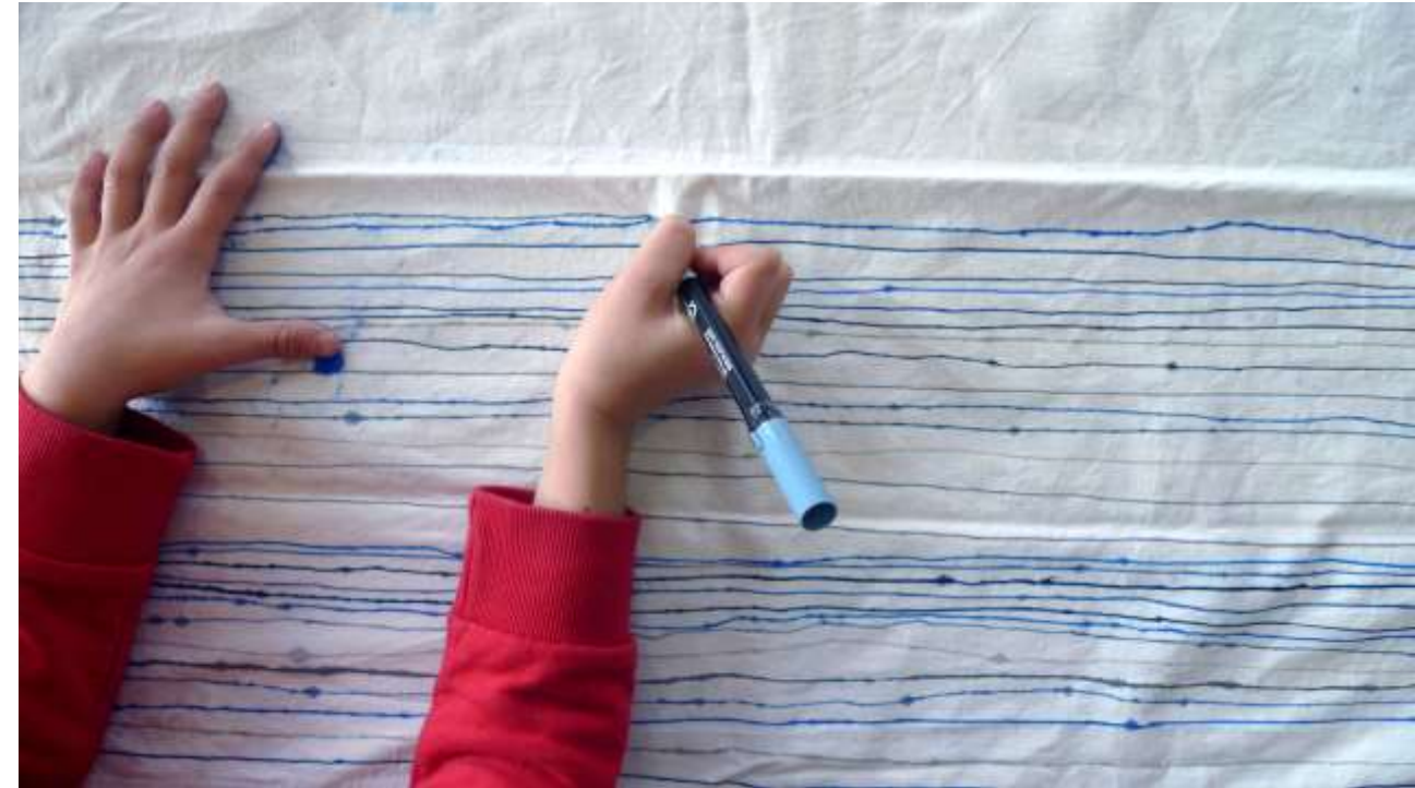
chacun son trait – dégradé de gris bleu œuvre participative, feutres sur tissu, résidence Maison Forte de Hautetour, Saint-Gervais, 210 x 130 cm, 2015