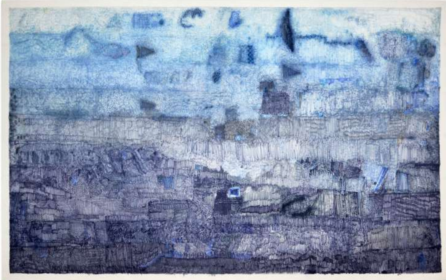
chacun son trait – dégradé de gris bleu feutres sur tissu, 210x130 cm, 2015-2017