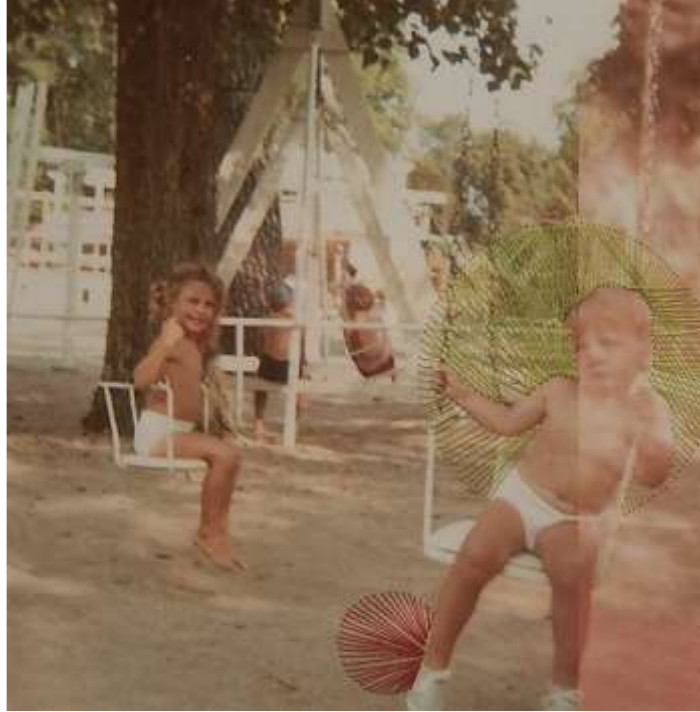
Ne vois-tu rien venir ? série J'étais une princesse photo, broderies au fil de couture sequins et perles 20x20 cm, 2015-2016