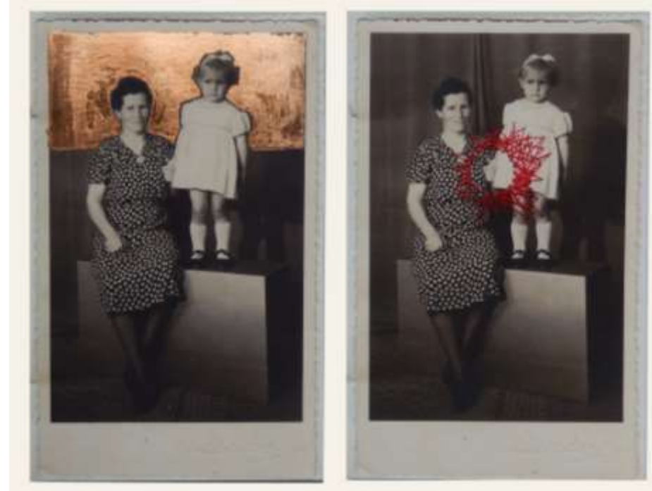
Elle s'appelait Aniela, Angèle, Agnès série AAA diptyque, feuille de cuivre, sequins fil de couture 13,5x21 cm, 2019