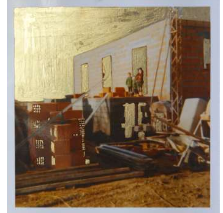
Les égarés, Une sacralisation de l'ordinaire détail photographie dorée à la feuille de cuivre 9x9 cm, 2018