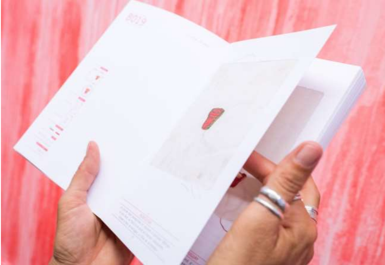
je dessine, vous brodez... Le livre aux éditions de L'Éclosoir vue de l'expo Trame de soi(e) La Petite Galerie F. Besson