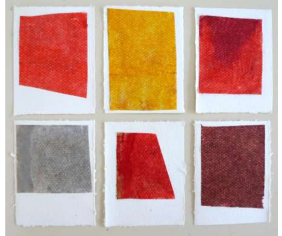
instantané de couleur - les polas dessin , collage sur sachet de thé 2016-2018